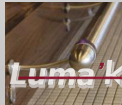
Tapa ½ esfera