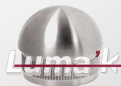
Tapa ½ esfera p/tubo 38.1mm Ø