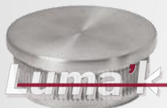
Tapa plana p/tubo 38.1mm Ø