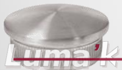
Tapa curva p/tubo 38.1mm Ø